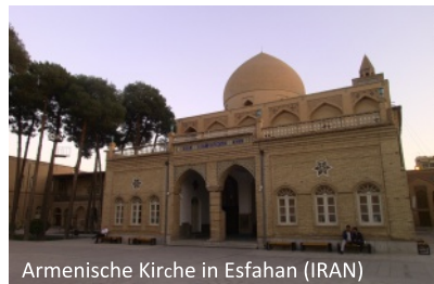
Armenische Kirche in Esfahan (IRAN)